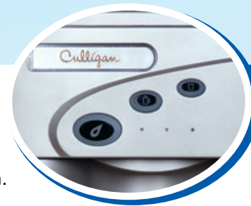
Dettaglio della pulsantiera per la selezione dell'acqua desiderata.

Culligan propone una linea innovativa di erogatori di acqua dal design esclusivo ed originale, adattabili a qualsiasi luogo ed attività.